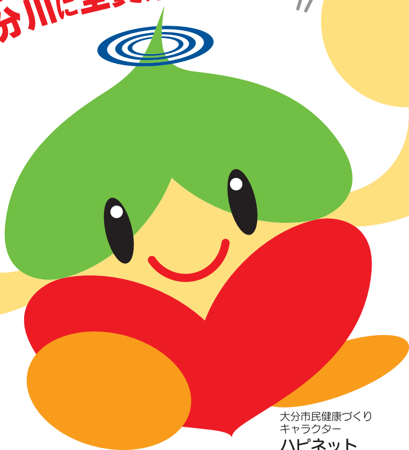
大分市民健康づくり キャラクター ハピネット