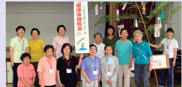
▲健康体操教室での七夕まつり

名前の由来は、地域住民がわいわいガヤガヤと楽しく、夢を語れるクラブになったらいいなとの願いを込めて名付けました。“子どもに夢と未来を・働きざかりに健康を・高齢者に生きがいを”をキャッチフレーズにスポーツ活動と文化活動を通じて、会員同志が共に助け合い支え合うクラブ創りを目指しています。会員相互の親睦を図り、併せて、地域の活性化と健康増進への寄与を目標に活動しています。