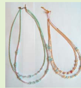
▲ピースのネックレス 名刺見本▶

名刺のプリントや、ハガキ、カレンダーの作成を行っており、ハビネットのイラスト入り名刺も作っています。障害がある人ない人明るく楽しく思いやりをもって一致団結の職場」を基本コンセプトとしています。ピース・アクセサリーや、野菜、ミニパン、クッキー、ケーキ等も作っています。みんなが明るく楽しく活動できる職場です。 【名刺作成料金】モノクロ100枚/1,500円(税込み)フルカラー100枚/2,000円(税込み)