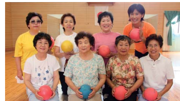
▲いつでも明るい笑顔…元気の源です

“身近な所で気軽にできる体操”の教室です。いつまでも健康・美しく!をモットーに、脳刺激体操ストレッチ、ボール筋トレなどを行っています。口の体操(おしゃべり)も賑やか。早いもので8年目に入り、参加者の中には病後の方、関節を痛めている方もいらっしゃいますが“自分なりに心地良く”体操しています。春のお花見ウォークなどもあり、のんびりゆったりな教室です。お気軽にご参加下さい。