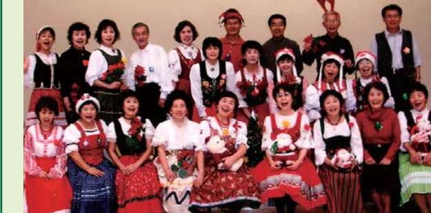
▲昨年のクリスマスに、踊った後の皆さんの笑顔です。

子どもから高齢者まで幅広い年齢層が、コンパルホール、大分市内公民館、体育館等で活動しています。主にレクダンスや、フォークダンスのリズムに合わせた有酸素運動の柔らかい動きで、健康を維持しようというサークル活動をしています。