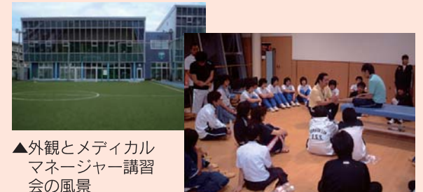
▲外観とメディカルマネージャー講習会の風景

当施設では、医療機関と綿密な連携の上、楽しく効果的な運動療法の指導を行い、継続的な健康管理を行っています。また、スポーツによるケガや故障を的確に診断し、早期復帰を目指したリハビリテーションを行うとともに、外傷・障害予防の知識普及を目的とした講習会も行っています。地域におけるコミュニティの場として、様々な触れ合いの場を通し、総合的なスポーツ文化の向上に寄与しています。