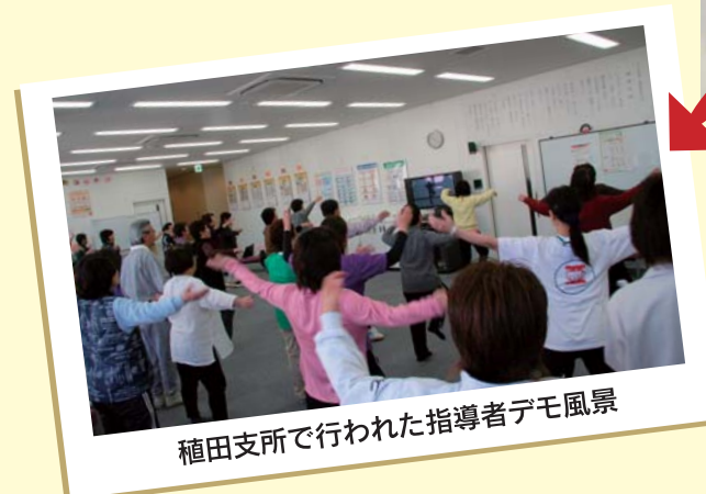
稲田支所で行われた指導者デモ風景