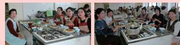
今日勉強したことを生かしていきたい

MENU 鶏手羽先の香味漬け・もずくスープ・菜の花の煮浸し・ゴールデンキウイゼリー