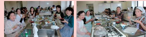
自宅でさっそく復習します