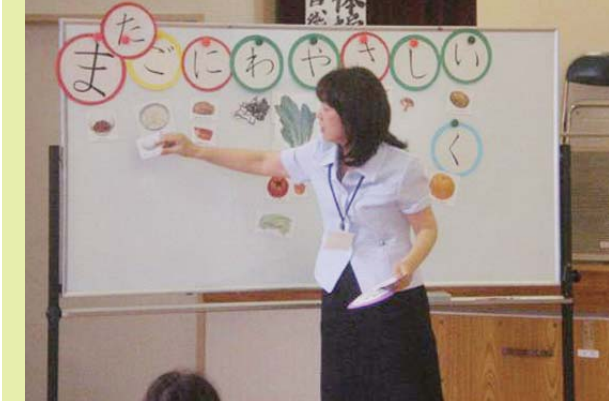
▲出前健康講座「健康な食事について」

川添なのはなクラブは、校区内全戸会員(6,717名)で活動しています。活動組織として会長、副会長をはじめ事務局、企画部、広報部、イベント部、スクール部、サークル部、文化芸能部、アグリー部がそれぞれ地域住民のニーズにあった活動を行っています。 8月8日には、クラブの一大イベントである、夏まつりが盛大に行われました。メインの「川添よさこいソーラン」は飛び入りも含め総勢100名を超え、熱気いっばいで祭りの最後をかざりました。