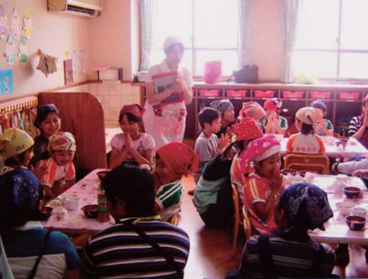
▲宗方保育園の3才～5才児さんとのクッキング

食を通して沢山の人の出会いは私達にとって大きな財産であることを改めて実感しています。 食育サポートチーム米粉インストラクターで、特に可愛い3歳～5歳、小学生との講習会では細心の注意が必要です。出来上がったものを一緒に食べる時、どの顔も満足そうで嬉しさが胸がいっぱいになります。 会員で協力しながら大分市でも、もっと沢山の方に食育を推進していきたいと思っています。